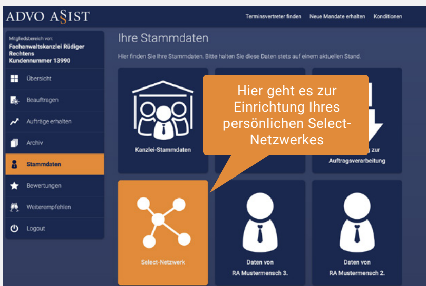
Abbildung - So gelangen Sie zu Ihrem Select-Netzwerk:

Die Zusammenstellung Ihres persönlichen Netzwerkes ist einfach